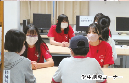
学生相談コーナー