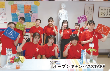
オープンキャンパスSTAFF